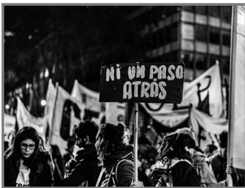
Marcha de antorchas, 17 de mayo de 2018, Buenos Aires