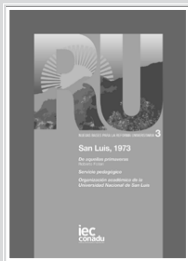
SAN LUIS, 1973: DE AQUELLAS PRIMAVERAS Roberto Follari