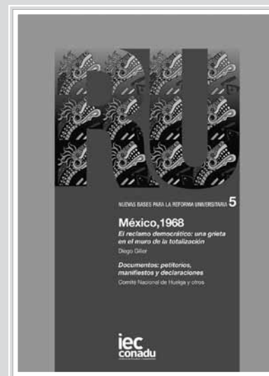
MÉXICO, 1968: EL RECLAMO DEMOCRÁTICO. UNA GRIETA EN EL MURO DE LA TOTALIZACION Diego Giller