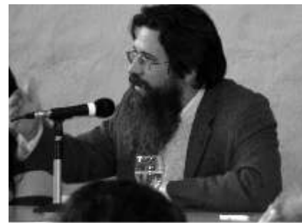
I Jornadas Nacionales "Compromiso Social Universitario y Políticas Públicas. Debates y Propuestas". Mar del Plata, 25 y 26 de agosto de 2011