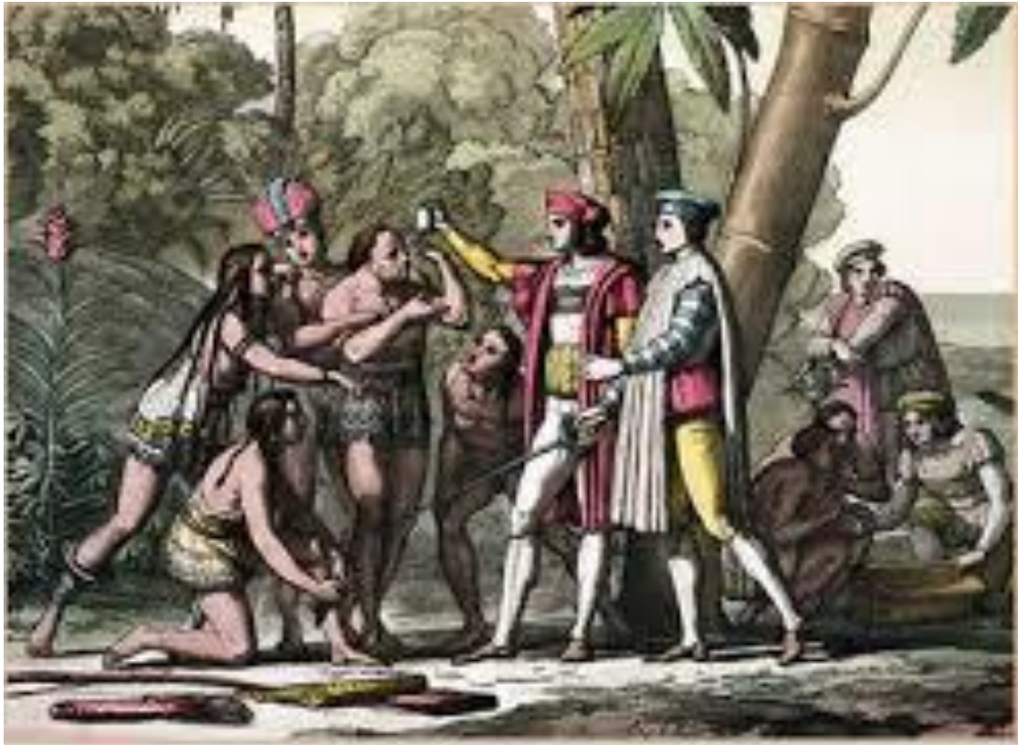
Intercambio entre nativos y españoles